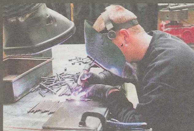
Ikke aft, hvad maskinfabrikken i Dronningborg laver, produceres med en stor CNC-maskine.