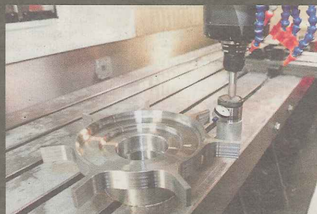
Virksomheden laver mange forskellige produkter. Her er noget til en togbremse.

I Jeg tænkte da, at Bo var godt tosset, da han begyndte for sig selv. Dét, fattede jeg ikke, at han gad. Men da jeg blev lidt ældre, fandt jeg ud af, at når man alligevel arbejdede så meget, så kunne man jo lige så godt have sit eget momsnummer.